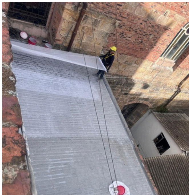
MANTENIMIENTO DE CUBIERTAS