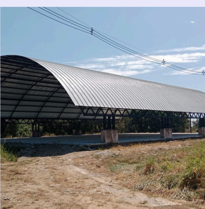
CURVADO DE TEJA STANDING SEAM