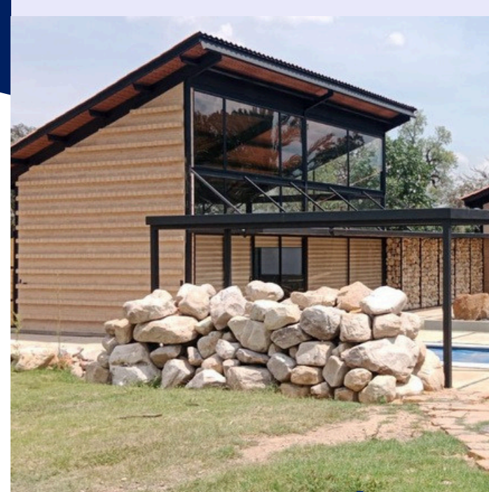
CONSTRUCCIÓN DE VIVIENDAS