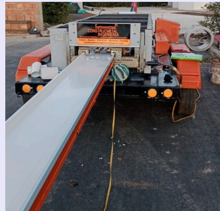
FABRICACIÓN DE TEJA