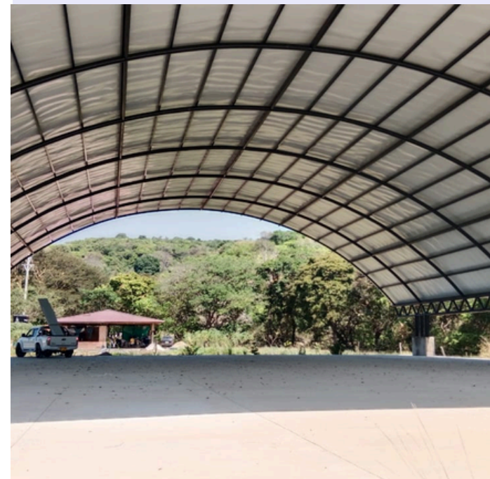
CONSTRUCCIÓN DE CAMPOS DEPORTIVOS